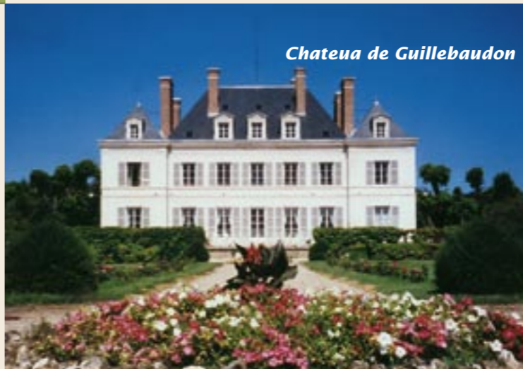
Chateau de Guillebaudon