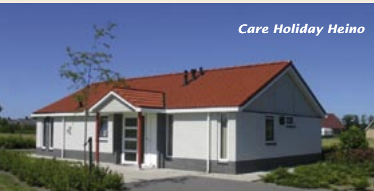
Care Holiday Heino

'Care Holiday Heino' is een gloednieuw bungalowpark bij Heino, in de buurt van Zwolle. Hier verrijzen 150 bungalows, waarvan in de helft speciale voorzieningen worden aangebracht voor mensen met een beperking. Heino is ontstaan vanuit de gedachte dat jong en oud, met én zonder beperking, onbezorgd met elkaar op vakantie kunnen. De RAZ wordt verantwoordelijk voor de 24-uurs service en zorg die op afroep ter beschikking staan van alle toeristen van het bungalowpark. Op de foto: De Gunne, een riante vijfpersoonsbungalow die volledig is aangepast voor vakantiegangers met een functiebeperking.